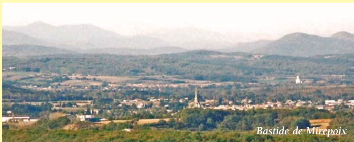
Bastide de Mirepoix

Départ : Lignairolles (place de l'église) Fiche Technique : Distance : 8 kilomètres. La distance peut être allongée de 5 kilomètres en empruntant une partie du sentier des crêtes d'Hounoux ou de 10 kilomètres avec sa variante. Dénivelé : 226 m. Durée: 2 heures. Cartes IGN: 1/25000. 2246 est Montréal - 2246 ouest Mirepoix. Balisage : • Traits jaunes. • Traits blancs et rouges sur le GR 78-7.