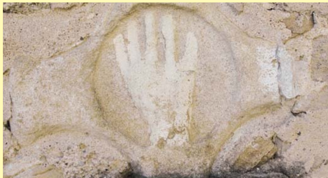
La Main de Sainte Anne

Seignalens est situé sur un promontoire entouré de hauteurs circulaires qui rendent le village intéressant. On y trouve des traces d'habitats très anciens. Après le village, au point de rencontre du sentier panoramique de Lignairolles et de Seignalens avec le GR7, ne manquez pas de monter au point de vue, pour admirer, au loin, la ville de Mirepoix au-dessus de laquelle émerge le clocher de la cathédrale.