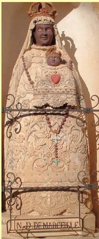
La vierge noire de Notre Dame de Marceille